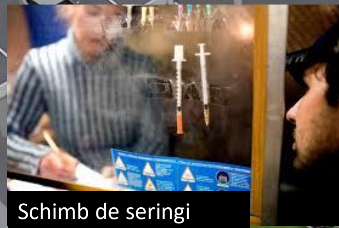
Schimb de seringi