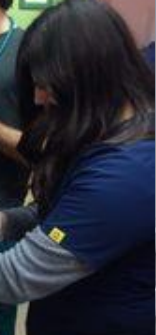
la, tratament, testare